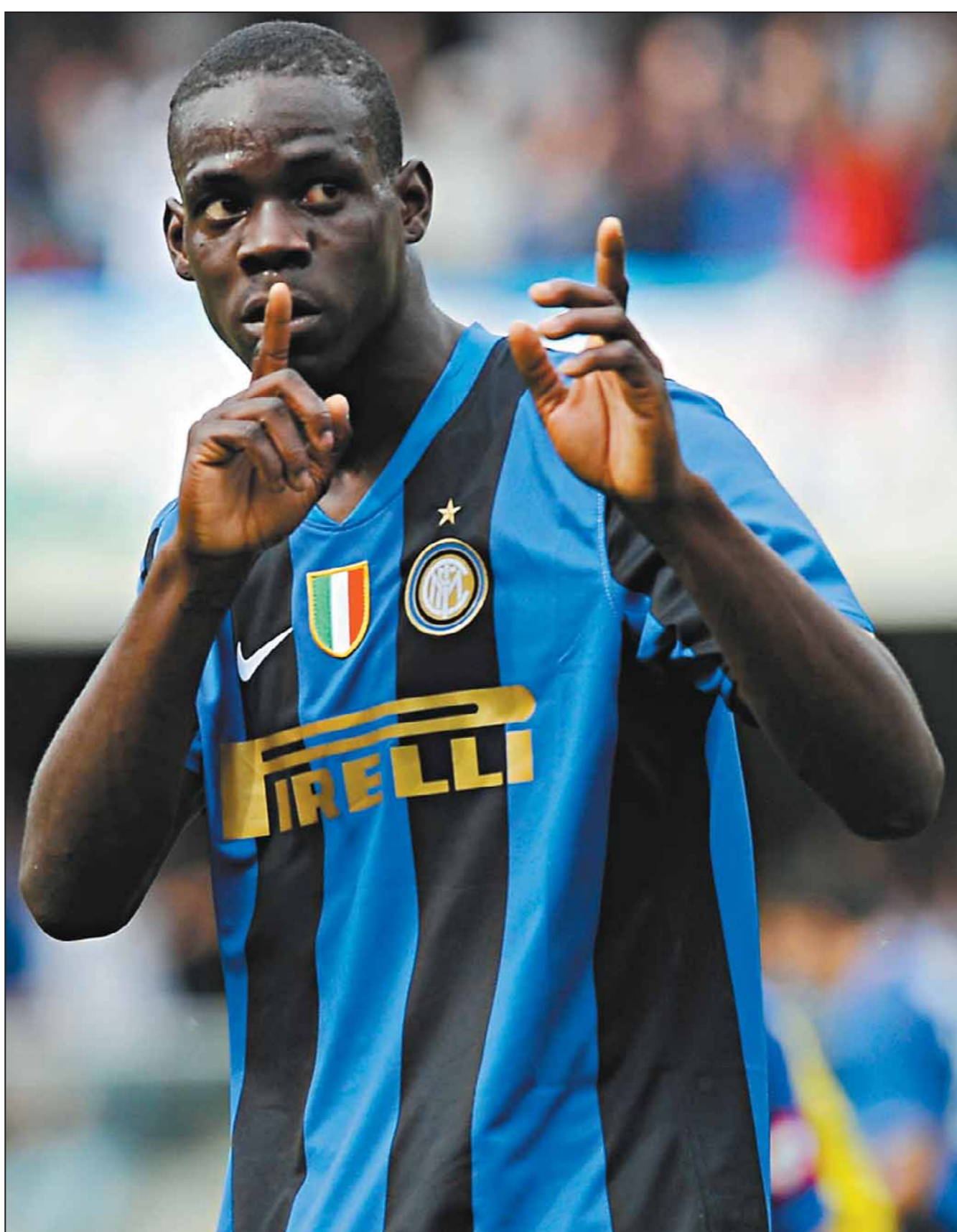
VÉRONE (Italie), STADE BENTEGODI, 10 MAI 2009. – Victime des insultes racistes des supporters du Chievo Vérone (2-2), l'attaquant de l'Inter Mario Balotelli, dix-neuf ans, qui vient de marquer, leur intime l'ordre de se taire.